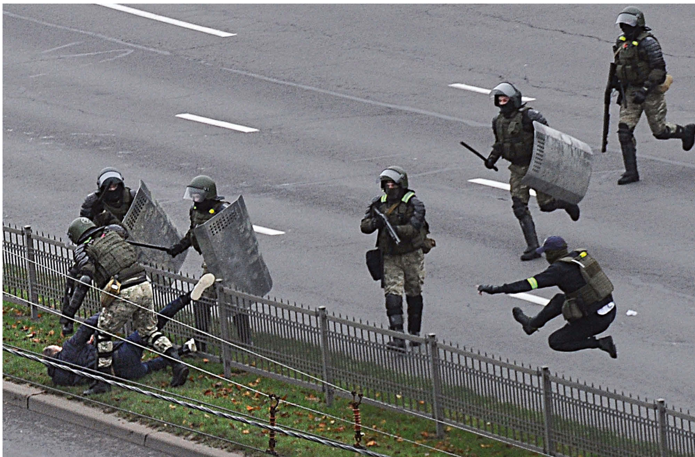
De belarusiska väpnade styrkorna har gjort sig skyldiga till omfattande övergrepp sedan protesterna inleddes.