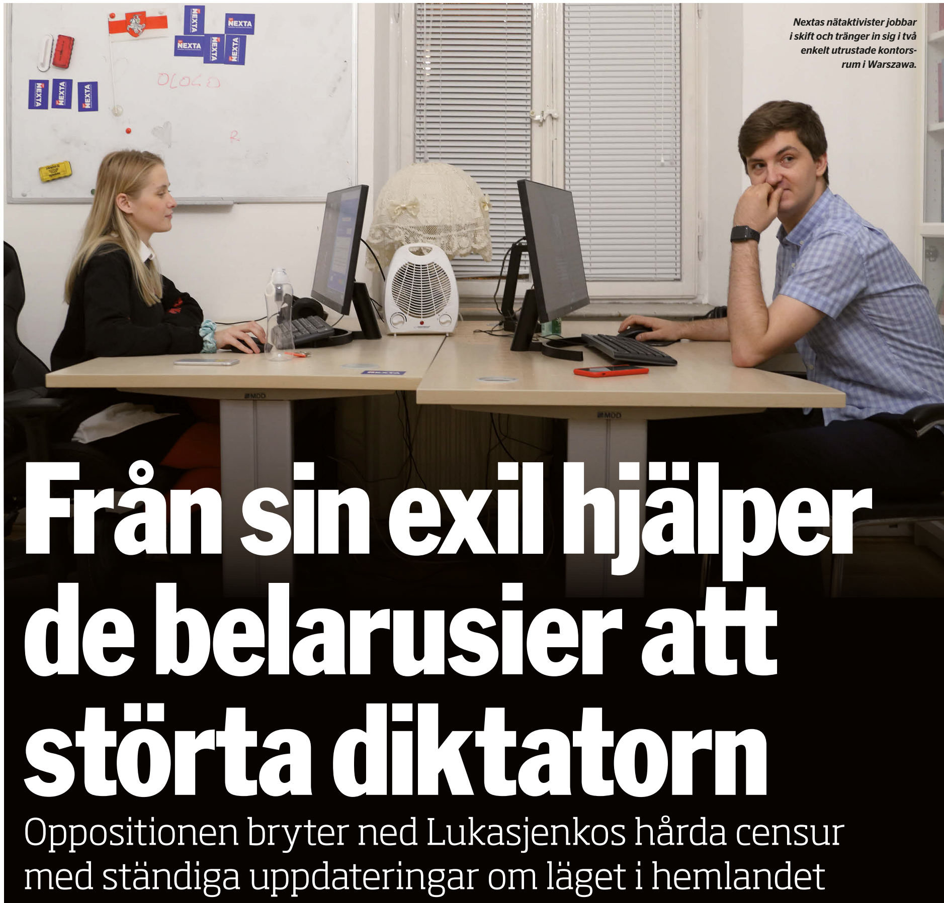
Nextas nätaktivister jobbar i skift och tränger in sig i två enkelt utrustade kontorsrum i Warszawa.