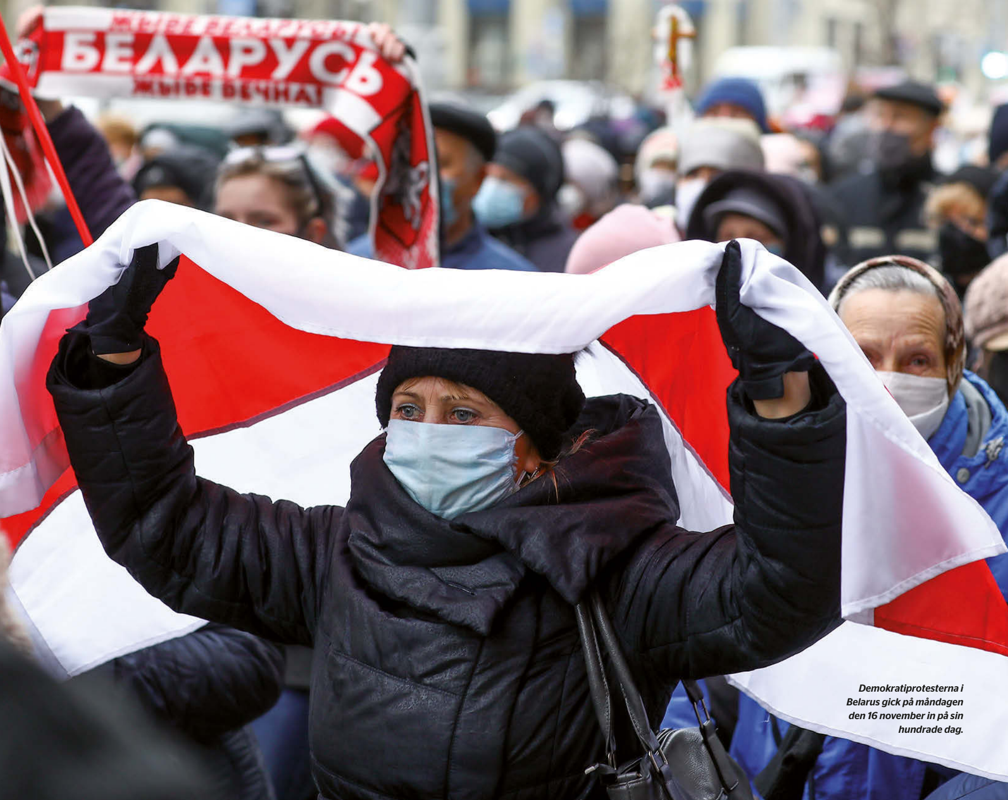
Demokratiprotesterna i Belarus gick på måndagen den 16 november in på sin hundra dag.