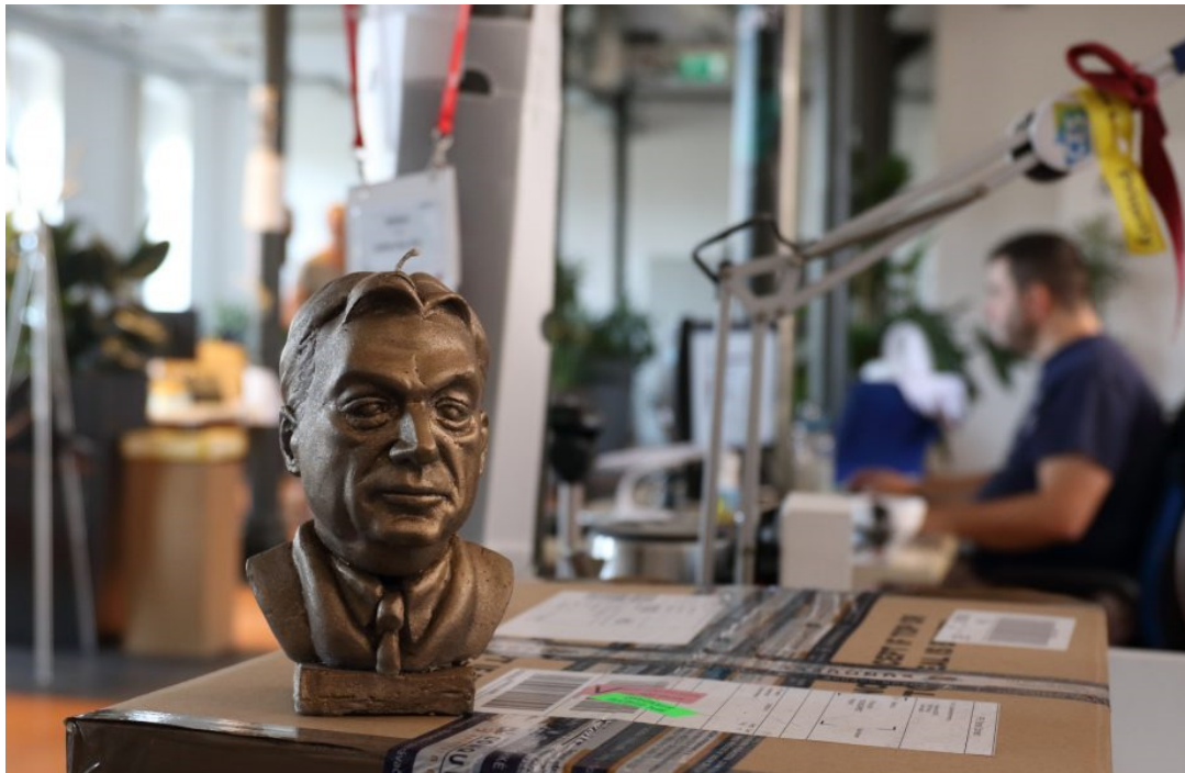
Premiärminister Orbán har i årtal gjort sig känd för att attackera pressfriheten och de fria medierna i Ungern.