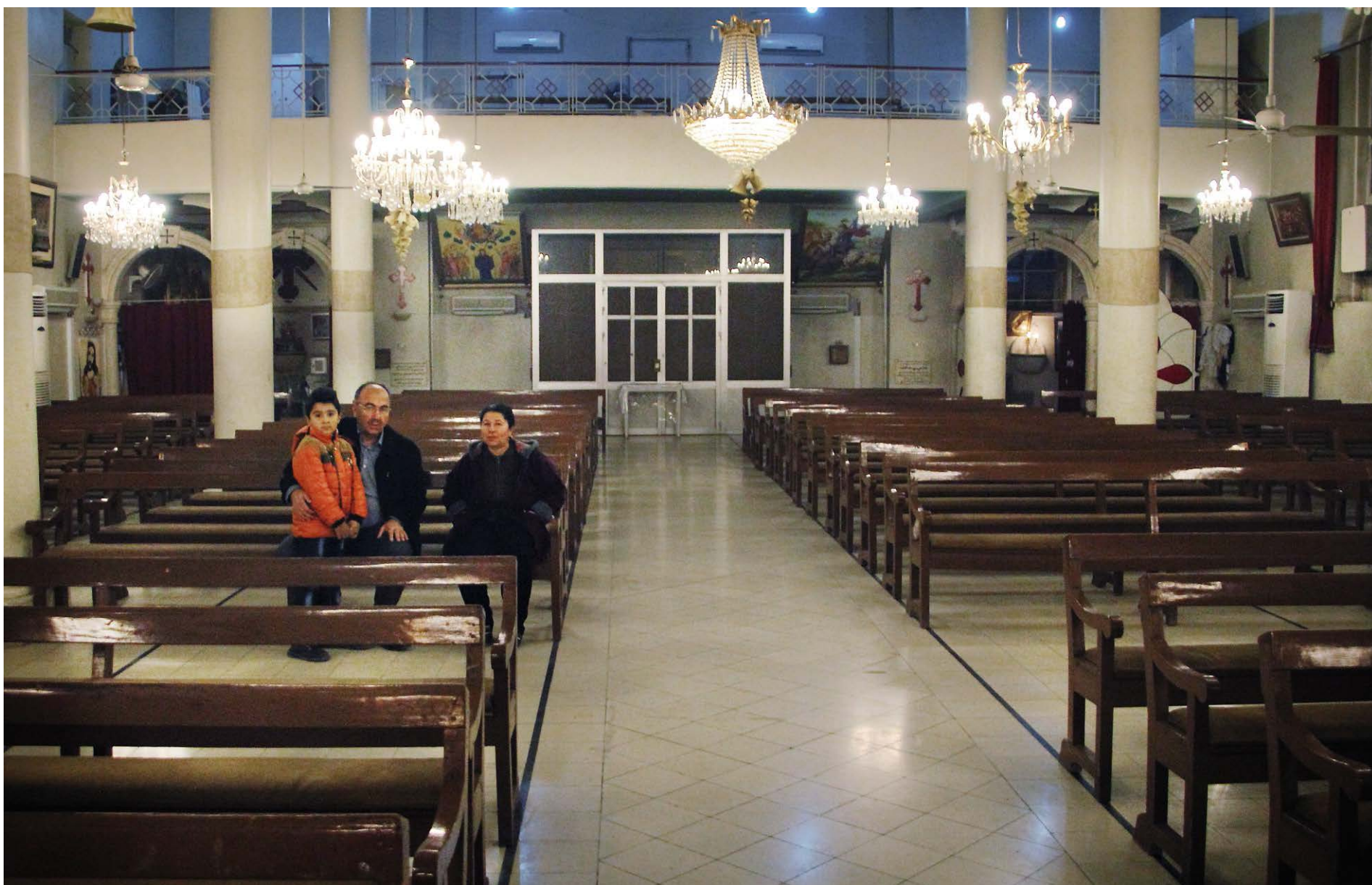
Det blir allt glesare i många kyrkbänkar i östra Syrien, i takt med den omfattande migrationen av kristendom. Här sitter Okin Shammoun som kidnappades av IS redan 2013, och avtvingades ett stort ekonomiskt belopp för att undvika tvångskonvertering eller avrättning.