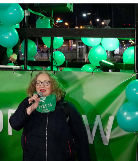
är dödshotad och riskerar årtal i fängelse