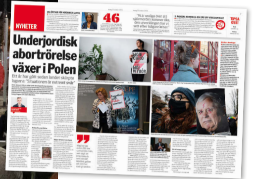
Dagens ETC 22 oktober.