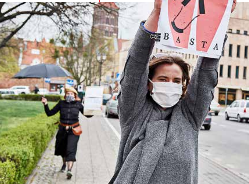
PROTEST I CORONATID. Demonstration med social distansering i Gdańsk den 15 april mot förslaget om ännu hårdare abortlag i Polen och kriminalisering av sexualundervisning.