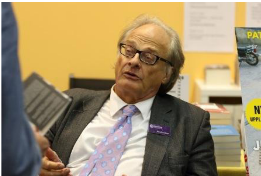
Patrick Cockburn har bevakat Mellanöstern i 40 år.

Han tror inte att Turkiet har några planer på att annektera mark i Syrien, men turkarna har tydliga intressen i landet som man vill värna. Att Turkiet också är en fortsatt stark aktör visade sig när de kunde förmå syriska rebeller att dra sig tillbaka från viktiga områden norr om Aleppo, för att istället sättas in mot området runt Jarablus – bara för att köra in en kil mot de expanderande kurderna.