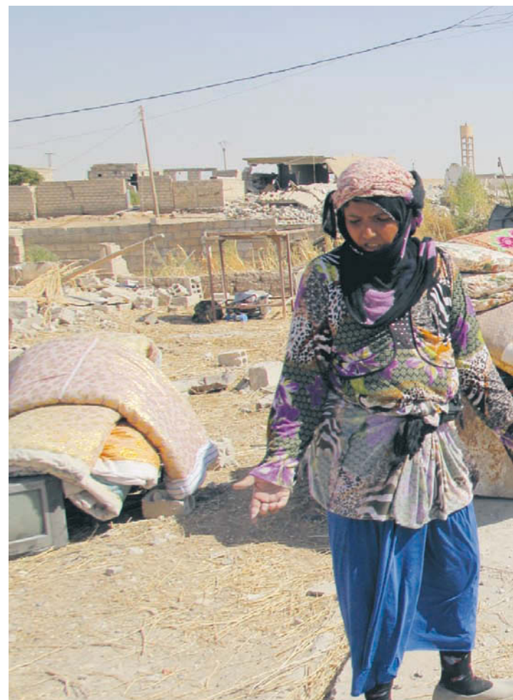
RUINER. I skymundan av den USA-ledda koalitionen luftkrig tvingades ge sig av.