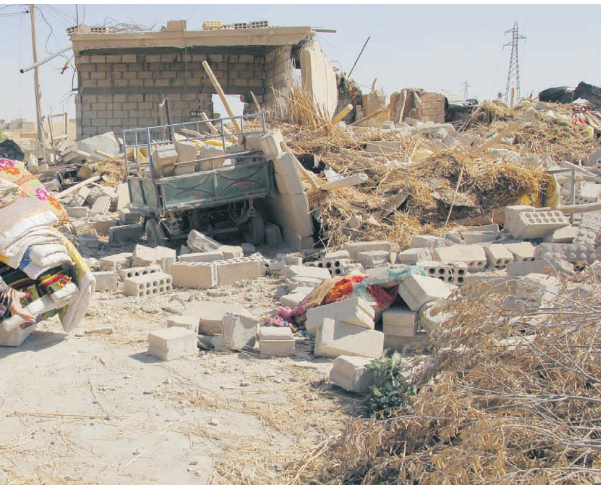
mot IS drabbas civilbefolkningen på marken hårt. Bybor i Hasakahs sydöstra utkanter miste allt i juli, och