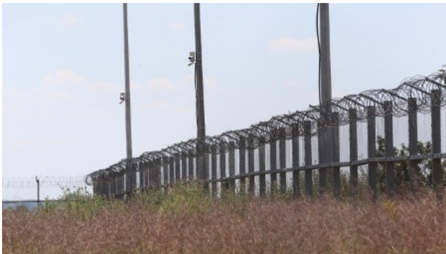
Ungern påbörjade bygget av sitt gränsstängsel på sensommaren 2015. Vid månadsskiftet april-maj i år stod ett andra stängsel klart.

Vid månadsskiftet april-maj färdigställde den ungerska regeringen konstruktionen av ett andra stängsel längs med den 175 kilometer långa gränsen mot Serbien. Barriären är fyra meter hög, har taggtråd på toppen, vakttorn med jämna mellanrum och en väg i mitten där polisbilar ständigt patrullerar. Precis som när det första stängslet restes på sensommaren 2015 för att stoppa den Balkanrutt som då tog hundratusentals asylsökare in i Europa, presenteras dagens gränsförstärkning som ett nationellt skydd. Landets premiärminister Viktor Orbán, som tidigare kallat flyktingar för ”ett gift”, sade i mars att illegala migranter ”belägrar” Ungern.