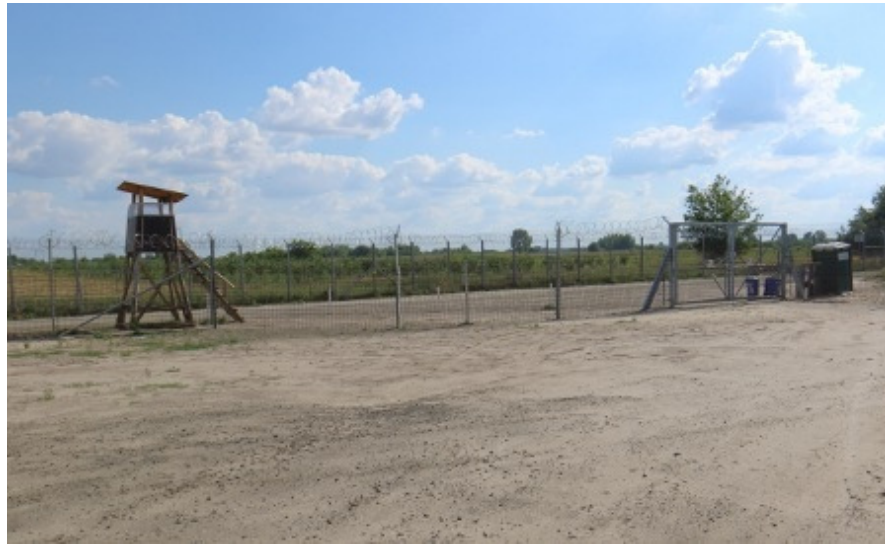
Vaktorn längs gränstängslet.

förbli på den linje regeringen redan stakat ut, med risk att inspirera fler länder till ett tuffare asylpolitik.