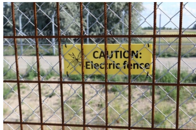
Det "intelligenta stängslet" är också elektrifierat, för att hålla borta flyktingar. Men ingen vet med hur många volt.

I Serbien drömmer flyktingarna om att EU ska öppna gränsen ( http://www.amnestypress.se/artiklar/reportage/26023/i-serbien-drommer-flyktingarna-om-att-eu-ska-oppna/ ) (12 februari 2017)