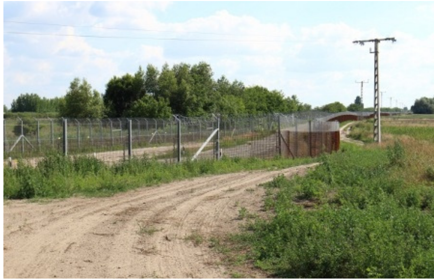
Kameror, megafoner och rörelsedetektorer gör att Ungerns regering talat om ett ”intelligent stängsel”.

Ungerns regering sade i maj att endast detektorsystemet har strömförsörjning, inte att stängslet är elektrifierat. Men när Amnesty Press lyckas ta sig ända fram till en annan sträcka av stängslet, den här gången utan att stoppas av polis, sitter där klart och tydligt gula varningsskyltar om elstötar, längs med hela stängslet. Med text på arabiska, engelska, serbiska och ungerska.