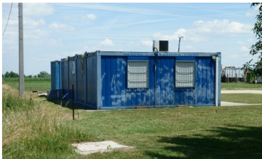
Asylsökare i Ungern måste bo i plåtcontainrar i stil med dessa, som är vanliga på byggnadsarbetsplatser och på den ungerska landsbygden.

– Ja, vi ser de där försöken, men Ungern kommer inte att ändra sin politik. Vi anser att den illegala migrationen måste stoppas, inte hanteras. Vi kommer att delta i de juridiska samtalen med EU eftersom vi anser att vi följer EU-lag idag.