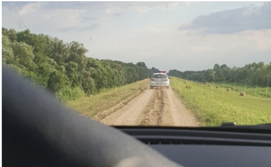
Ungersk polis eskorterar här bort Amnestys Press reporter från gränsområdet, som polisen hävdade var förbjudet för civila att beträda.

På en liten landsbygdsväg i södra Ungern signalerar en mötande polisbil att jag ska stanna till vid kanten. Konstapeln ber att få titta på mitt pass och kontaktar genast kollegorna över walkie-talkien. Snart har ytterligare två patrullbilar anlänt. Poliserna genomsöker min hyrbil och frågar om min professionella kamera. Jag ger dem mitt internationella presskort och förklarar att jag är journalist. Då kliver ett befäl fram och berättar vad som är fel.