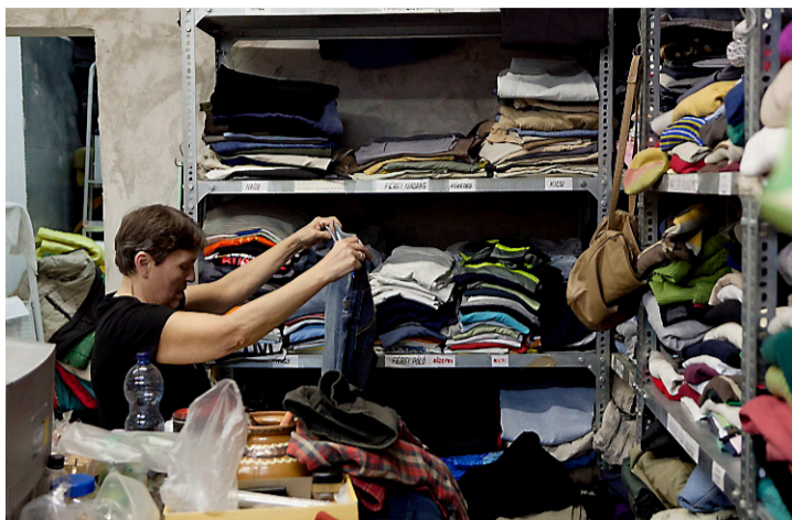
Det är torsdag, vilket betyder utdelning av kläder som kyrkan samlat in åt de hemlösa. En kö samlas framför lagerrummet.

En religionslag har tagit ifrån de ungerska trossamfunden deras rättigheter. Metodistkyrkans ledare ser ett hot mot demokratin – och mot de fattiga som behöver kyrkans hjälp.