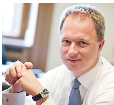
Regeringens statssekreterare Ferenc Kumin ser inget problem med att Metodistkyrkan fått sin kyrkostatus indragen.