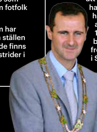
ÅTER VÄN? Turkiet tycks ha gett upp målet att störta Bashar al-Assad.

Tidigare var Turkiets mål att avsätta Bashar al-Assads regim i Damaskus men nu betonas att ”Syriens territoriella integritet måste bevaras”. Förutom att slå tillbaka IS vill Turkiet försvaga Rojava, det kurdiska självstyret i norra Syrien som ses som en del av PKK. USA har försökt medla för att undvika att Turkiet och YPG/SDF hamnar i öppen strid. YPG och SDF har förklarat att de ska respektera avtalet om eld upphör i Syrien den 12 september. Hittills har Turkiet blockerat kurdernas deltagande i fredssamtal om en politisk lösning i Syrien.