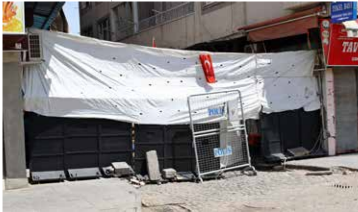
STÄNGT. Avspärningar runt Sur i Diyarbakir. Här pågick strider fram till i mars i år.

”Ingen får gå igenom här. Plocka inte fram din kamera heller, polisen ser dig och tar dig direkt om du försöker fotografera.”