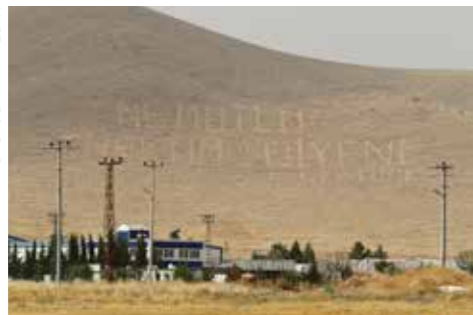
ÅTERBRUK. ”Lycklig är den som kan kalla sig turk” dammas av igen.

– Men för några månader sedan dammade armén av dem igen. De planerar även att markera bokstäverna med kritvita stenar så att de ska synas tydligare, säger vår kurdiska chaufför, som kommer från Mardin.