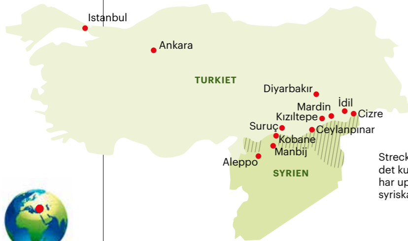
Strecket område är Rojava, det kurdiska självstyre som har uppstått under det syriska kriget.