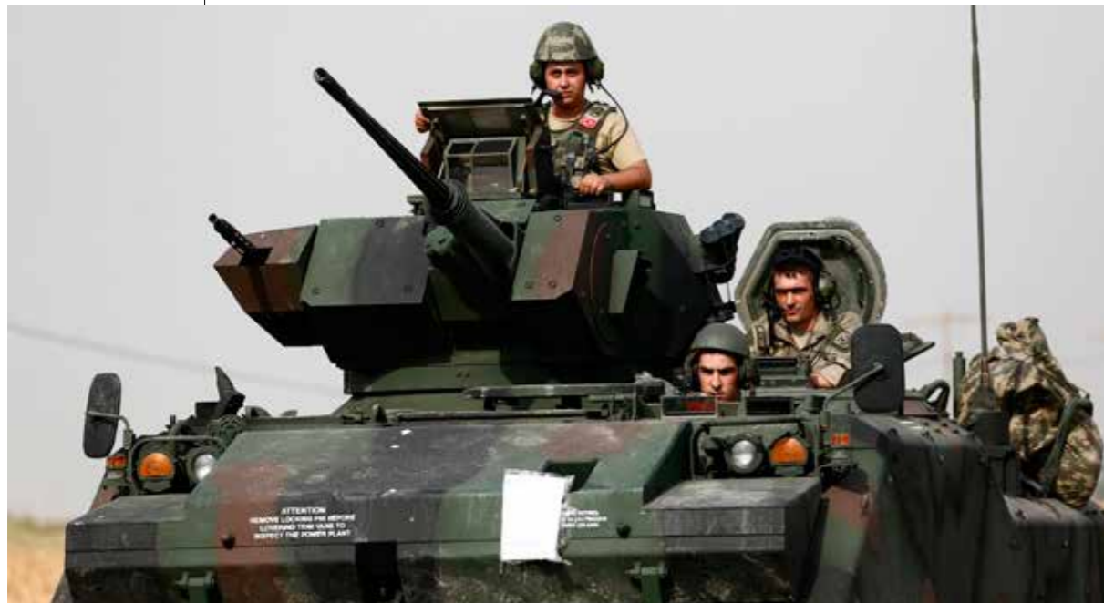
MOT IS. Turkiska stridsvagnar på väg mot Syrien den 26 augusti för att attackera Jarablus.