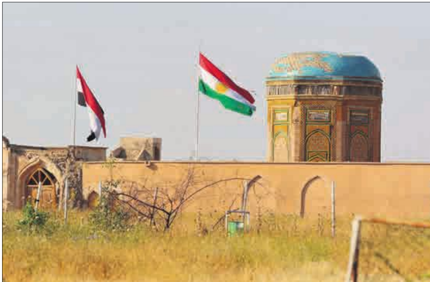
SYMBOLSK: Heisingen av det kurdiske flagget ved Kirkuks festning i mars førte til kraftige protester i Bagdad.

Men Ahmed Askeri sier at det også handler om kontrollen over Kirkuks enorme reserver av olje og naturgass.