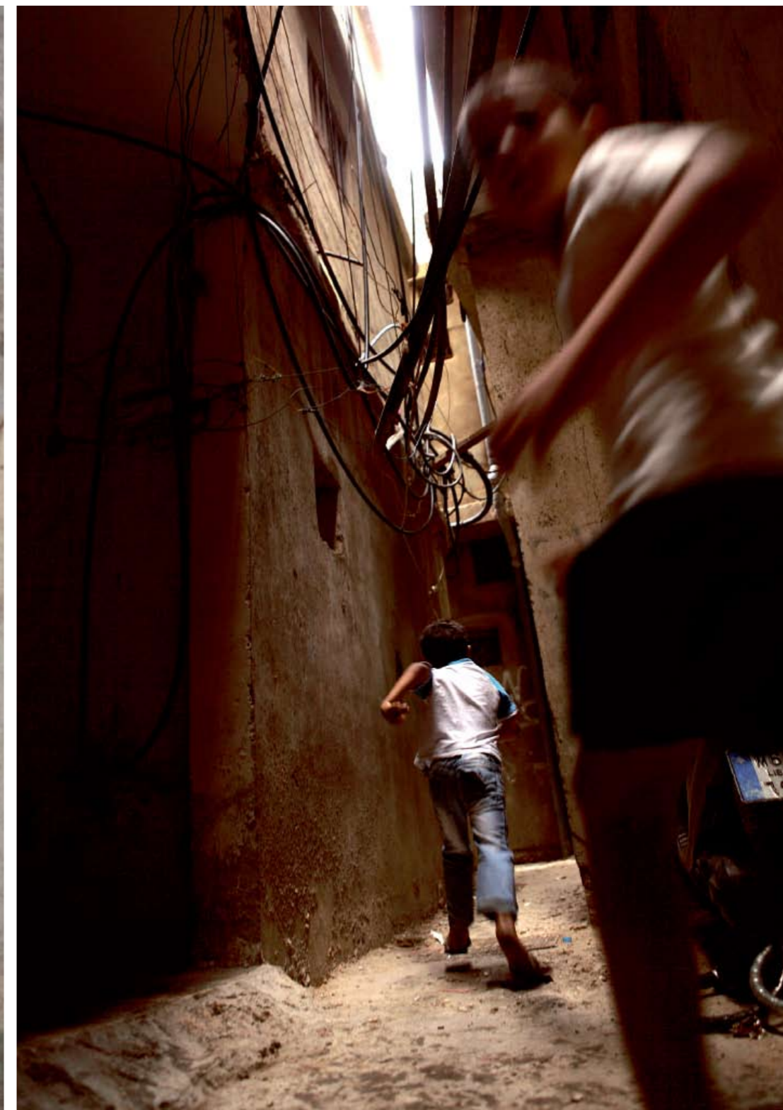
Syrien är barn under 17 år.