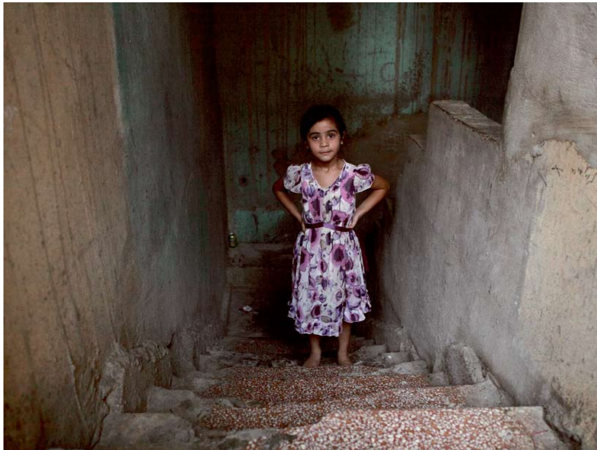
TRÅNGT. Det palestinska flyktinglägret Shatila i Libanon blir allt trängre. Beredskapen för en ökad mängd flyktingar från krigets Syrien är otillräcklig i landet. Majoriteten av alla som flytt